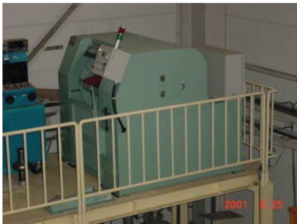
図1：遠心バレル研磨装置

昨年度末、多セル空洞用に試作した遠心バレル研磨装置(図1)を使い、ニオブ製Lバンド3セル空洞の遠心バレル研磨を行った。8時間の連続研磨を2度行い、研磨重量より換算し平均 43\mu\text{m} 、 44\mu\text{m} の高速研磨に成功し、再現性も確認された。従来のバレル研磨では平均 30\mu\text{m} の研磨に約1週間を要し