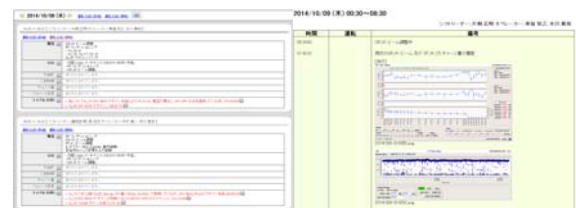
(a) Summary information. (b) Detailed information.

本運転ログでは、オペレータインターフェースのスナップショットなど、画像情報の掲載が可能である。これにより、ビーム調整の詳細な状況を把握することがより容易となった。さらに、本運転ログは複数キーワードを用いた高速情報検索機能を有している。障害発生時には、過去の同様な障害事例を検索し、対処方法を参照することが可能である。今後は、障害情報を運転ログに記載した際、関連する機器担当者へ自動的にメールアラートを送信するなど、さらに運転効率を向上させるための機能を実装していく予定である。